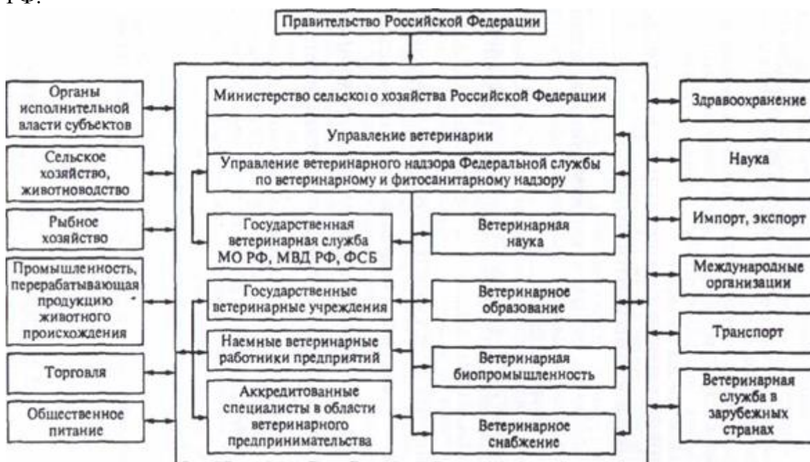
Схема 1. Структура, внутренние и внешние связи ветеринарии Российской Федерации.

Практическое занятие №3. Анализ логической схемы – Система ветеринарной службы РФ.