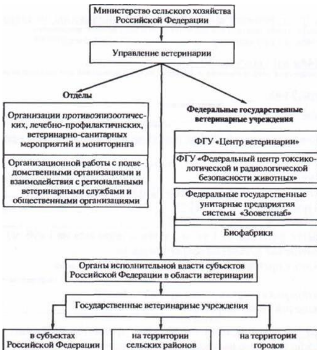
Схема 2. Структура государственной ветеринарной службы